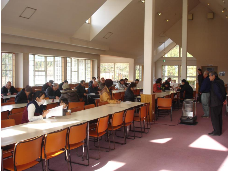
シーズン前顔合わせ

当社では、輸送や皆さまの安全に役立つよう、シーズン営業開始前に顔合わせを行い、施設及び取扱いについての安全教育の実施や、郡上北消防署から講師を招き、心肺蘇生講習、消火訓練、避難訓練を行いました。